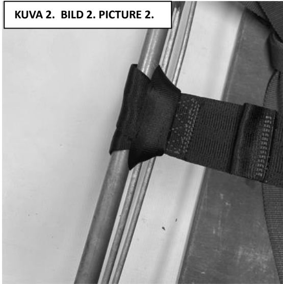
KUVA 2. BILD 2. PICTURE 2.